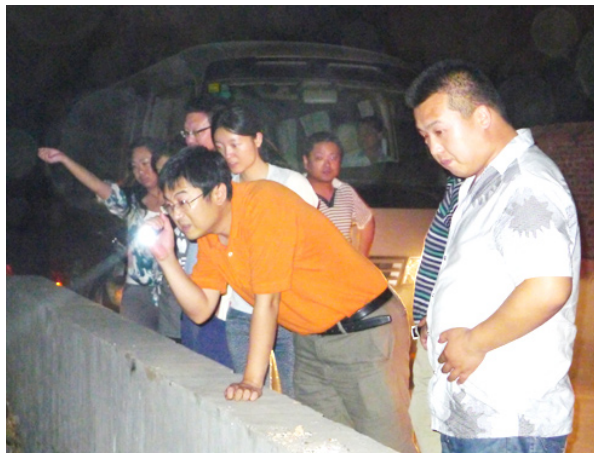
藁城环保调研团与藁城环保监察大队夜间出勤，来到汪洋沟现场监察水质。