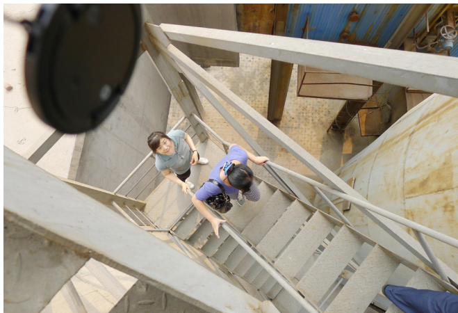
这是热电厂烟囱平台，脚下都是悬空的，可以直接看到地面，真的有点恐怖啊。据了解，即便是这种艰苦的工作，还是有女环境监察人员从事这个工作。（藁城环保调研团）

跬步之间的坚持：一步、两步、三步，十米、二十米、三十米，每次数十站往返测量，每站测量距离30—60米，每天上午下午各测一次；此外，每年还有6次、全年行程万余公里的野外流动水准测量；无论严寒酷暑、日晒雨淋，无论虫叮蛇咬、悬崖落石，都定时定点雷打不动。（山西代县中心地震台调研团）