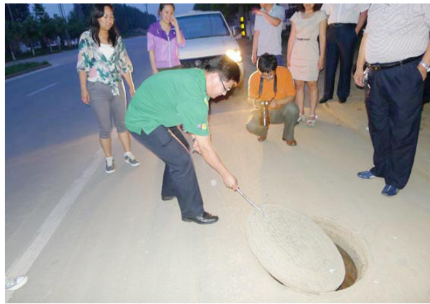
藁城环保调研团一团员正在尽全力掀起重60斤的井盖，看样子真的很费力。据了解，每天一个中队要掀起这样的井盖28次。