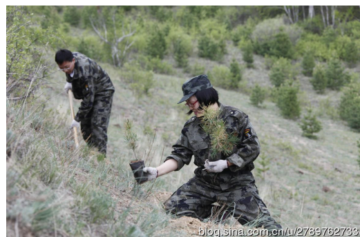
这样的山坡地，就得跪着干活

传承： 在塞罕坝林场的6天里，无论我们走到哪里，无论是在什么样的场合，一说到林场，塞罕坝人的脸上都充满了自豪。他们有资格自豪，今天的塞罕坝每年为京津地区净化输送清洁淡水1.37亿立方米，固碳74.7万吨，释放氧气54.5万吨，每年提供的生态服务价值超过120亿元。今天的塞罕坝再也不是当年来了就想走，走不了就想跑的地方了。当我们问起现在的林场是不是一个让人羡慕的工作时，阴河