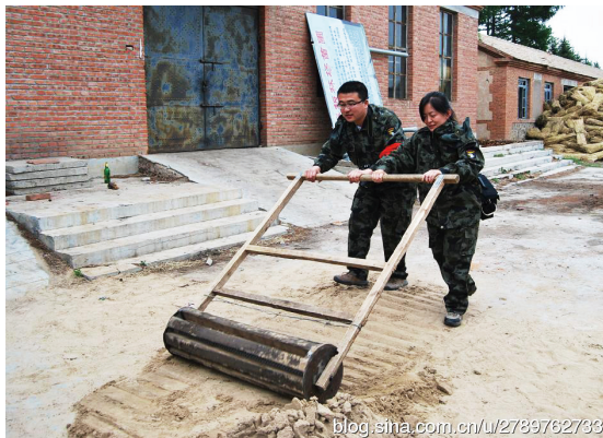
在塞罕坝千层板林场苗圃学习播种机使用方法