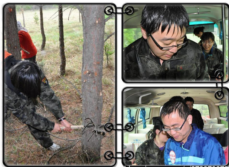
修枝作业中遇雨，和林场职工共进退，被淋成落汤鸡

后记： 6天的时间很短，在这6天里，林场的领导为我们的到来精心准备，周到细致的安排让我感动；我们20个团员一起经历、一起欢笑、相互支持、相互帮助让我感到温暖。这6天，将是我一生的回忆和财富。