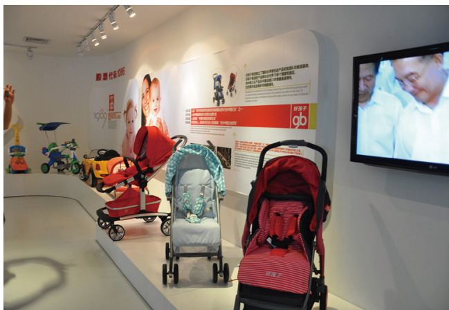
“好孩子”的发展之路，是昆山创新改革的缩影。

昆山在过去20年对台经贸交流与合作中创造的奇迹。在当地政府和人民群众的鼎力支持下，两岸同胞携手并进，积极开展企业科技创新，助推工业经济提档升级。今天，即使是对昆山抱有不同看法的人也不得不承认，这个与台湾没