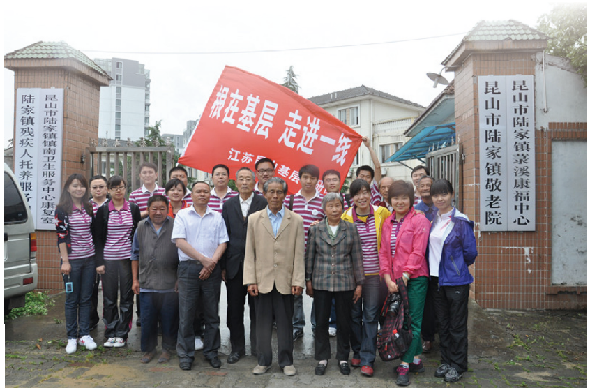
调研团在昆山市陆家镇敬老院慰问，感受一个经济发展强市的人文温暖。

我们所处的这个时代，是一个转型升级的时代。我们的企业和每一个人，都在全力开创。究竟我们该如何开创，未来该如何发展？什么是创新创造？中国该怎样去创造？中国创造的核心和根本又在哪里？