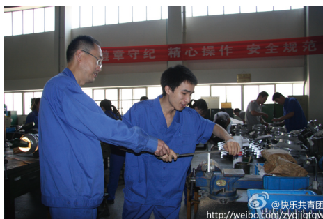
◇师带徒。（西安航天科技集团六院调研团）